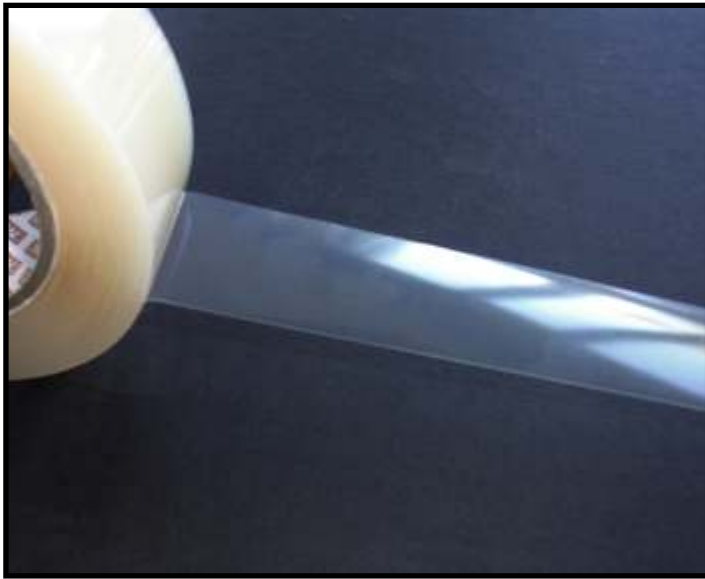
Korrekt von der Rolle abgezogen